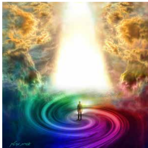
"נתיב האור" 80x80 ס"מ. 800 שקל