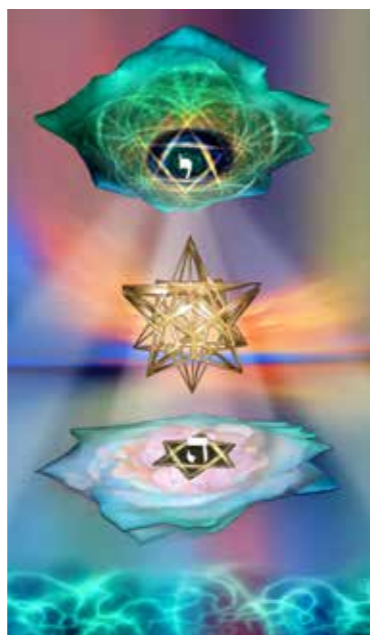
"שושנת ישראל" 60x100 ס"מ. 1,000 שקל