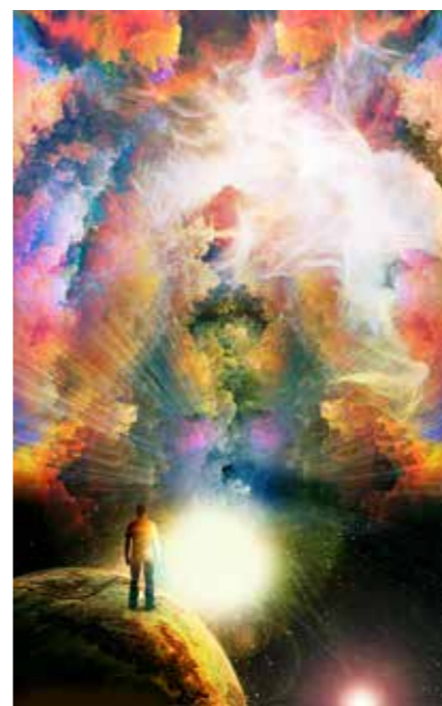
"התעוררות" 50x90 ס"מ. 800 שקל