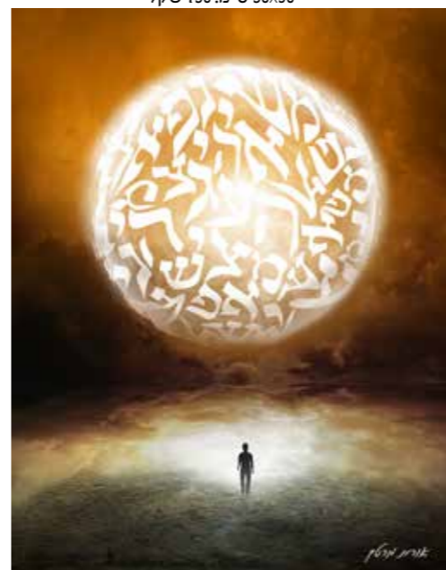
"אותיות בראשית" 70x100 ס"מ. 1,000 שקל