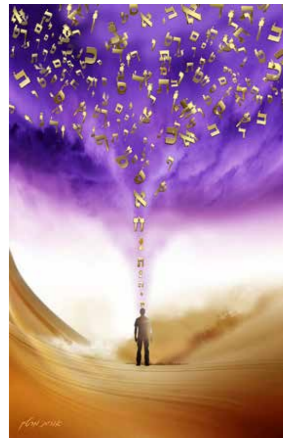
"שפע" 64x100 ס"מ. 1,000 שקל