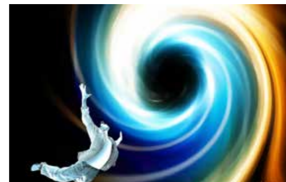
"אורות" 70x90 ס"מ. 850 שקל