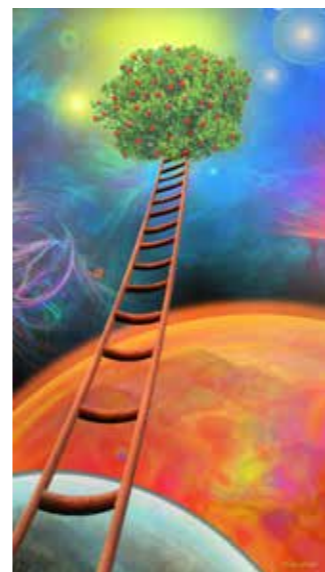
"פירות של מעשים טובים" 50x90 ס"מ. 750 שקל