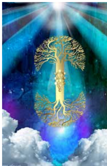
"עץ החיים" 70x50 ס"מ. 650 שקל