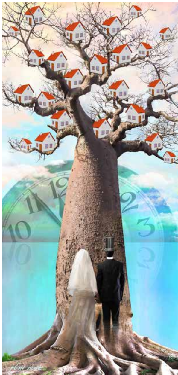
"בניין עדי עד" 40x90 ס"מ. 750 שקל