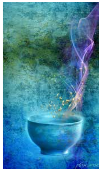
"קערה כחולה" 90x60 ס"מ. 750 שקל